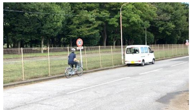
実演動画 (駐停車車両の側方通行)