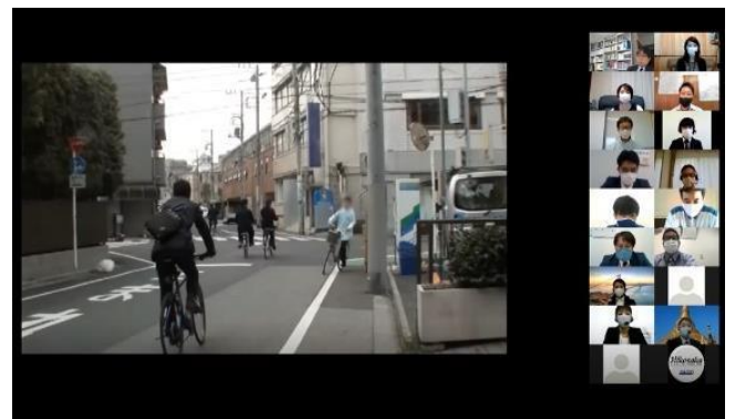
実演発表 (ディスカッション)