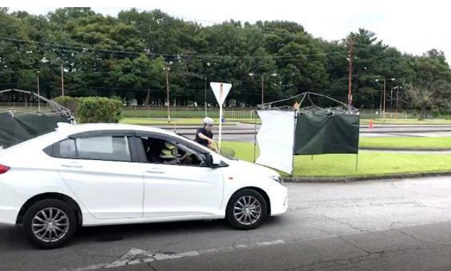
実演動画 (見通しの悪い交差点)