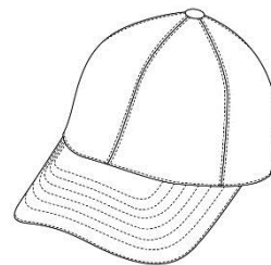
図 1-2 キャップ型の例 2 (バイザー付き)